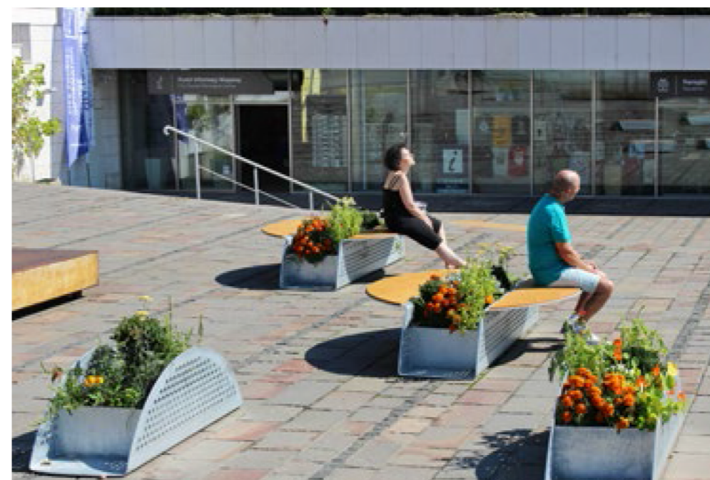
Meble z donicami można swobodnie aranżować na placu Powiśla 11, dostosowując ich układ do planowanych wydarzeń czy ekspozycji na słońce