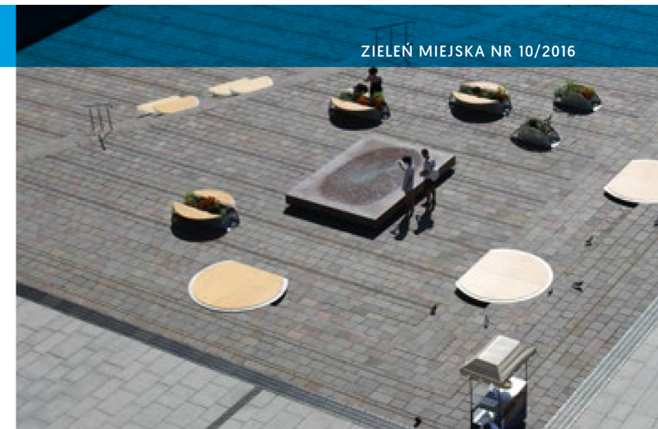
Pierwszy etap aranżacji dolnych tarasów CORT z zestawem różnorodnych siedzisk wokół istniejącego pomnika „Ślad” – ich forma wpisuje się w otoczenie, wykorzystując stopnie jako bazę siedzisk

Ciemny kolor liści kontrastujący z soczystą zielenią roślin wprowadzają delikatne liście fenkuła włoskiego ‘Purpureum’ ( Foeniculum vulgare ), któ-